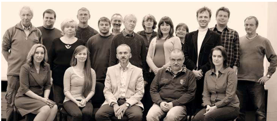
Obr. 5 Kolektív VÚGK 2015

tových vrstiev, aby informácie boli dostupnejšie a ich zdieľanie jednoduchšie. To sa malo dosiahnuť bez budovania centrálnej databázy, zdieľaním informácií a údajov pomocou štandardných služieb. Projekt poskytoval základné kartografické datasety pre Európu, týkajúce sa nasledujúcich tém: administratívne jednotky, hydrografia, dopravné siete a výškový model. V rámci projektu bol vyvinutý spoločný údajový model a podporné nástroje na hodnotenie spoločných štandardov, a tak umožnený prístup ku konzistentným a homogénnym referenčným údajom, poskytovaných kartografickými inštitúciami z rôznych krajín a na rôznych úrovniach (národných, regionálnych a lokálnych) s pomocou modelov INSPIRE a podľa požiadaviek smernice INSPIRE (2007/2/ES). V projekte GIS4EU bolo zastúpených vyše 25 rôznych partnerov takmer z celej Európy. Konečné výsledky, získané spoluprácou všetkých účastníkov, boli zapojené do vývoja Global Spatial Data Infrastructure (GSDI), poskytli výsledky zo série reálnych prípadov a vyvinuli prevádzkové a praktické inštrukcie pre implementáciu smernice INSPIRE.