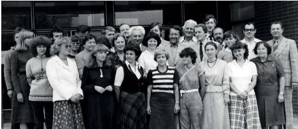
Obr. 4 Kolektív VÚGK 1982